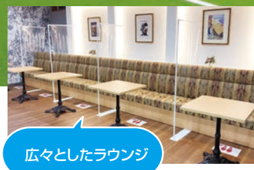
広々としたラウンジ

クッション性を重視した足腰に優しい屋内専用高密度人工芝コート、1面600㎡以上、天井高10m(姪浜駅前校を除く)有しており、十分なコートの空間(広さ・高さ)でプレーができます。