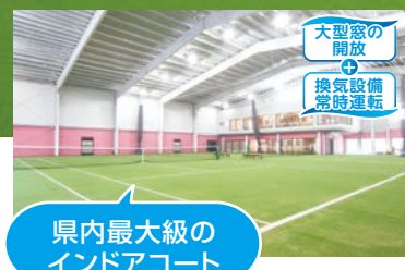
県内最大級の インドアコート

※入会手続きの際は、(通常)入会金2ヶ月分の受講料(クレジット払い可)口座のキャッシュカード印鑑が必要となります。 ※商品のデザイン・色は変更になる場合があります。