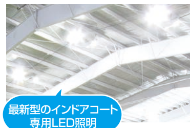
最新型のインドアコート 専用LED照明

清潔感あふれるオシャレなパウダールーム。使いやすさ大きい鏡の化粧台や充実のアメニティ、広めのシャワーブースや無料ロッカー完備など、女性に嬉しいポイントがいっぱいです。