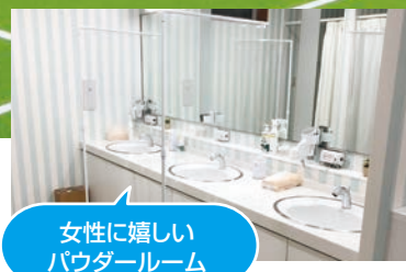
女性に嬉しい パウダールーム

ラウンジは座り心地のよいイス、温かみのある照明など、レッスン前後にご利用いただけます。換気、消毒を徹底し、現在は、3密を避けるために、イスを間引いてソーシャルディスタンスの取り組みをしています。